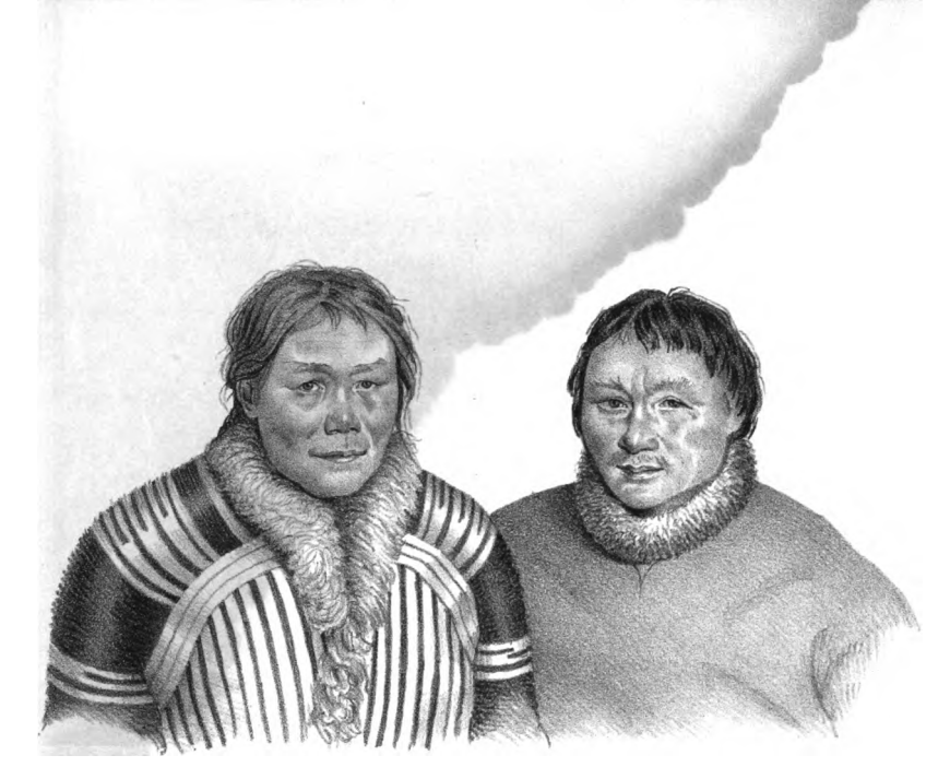
Kánin - Sámojeder.