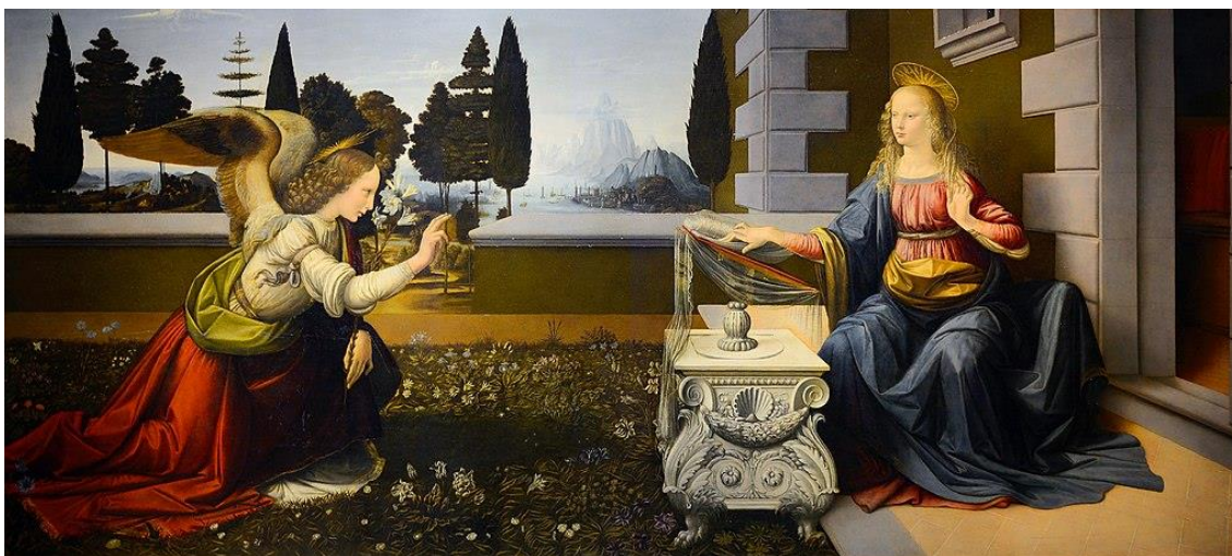
La Anunciación (en italiano, Annunciazione ) es uno de los cuadros más célebres del pintor renacentista italiano Leonardo da Vinci . Está pintado al óleo sobre tabla (madera de álamo) que mide 98 cm. de alto y 217 cm. de ancho y data del periodo 1472-1475. Se conserva en la Galería de los Uffizi de Florencia.

Lo antedicho es meramente una construcción intelectual sin ningún fundamento en la T.A. y se explicará porque.